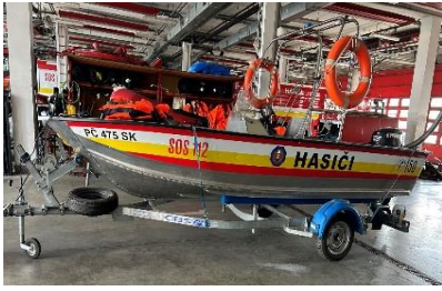
Hliníkový čln „Marine“