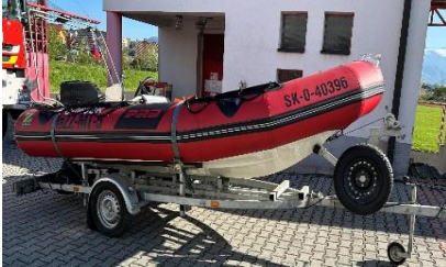
Čln – ZODIAC